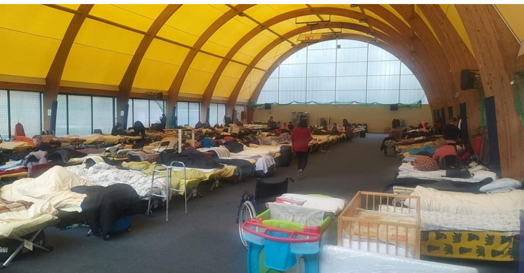
Hala sportowa Poznań Kiekrz