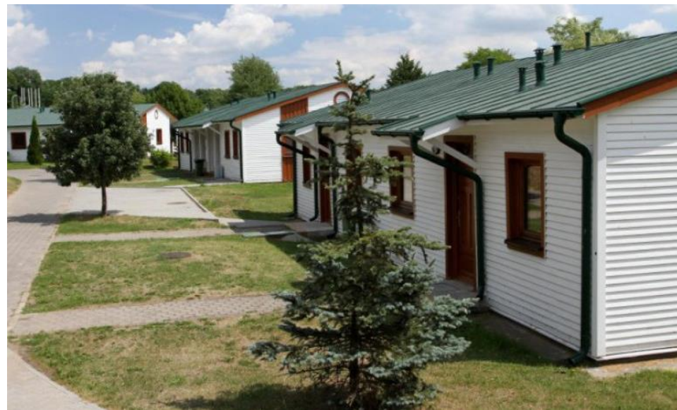
Camping Malta ul. Krańcowa