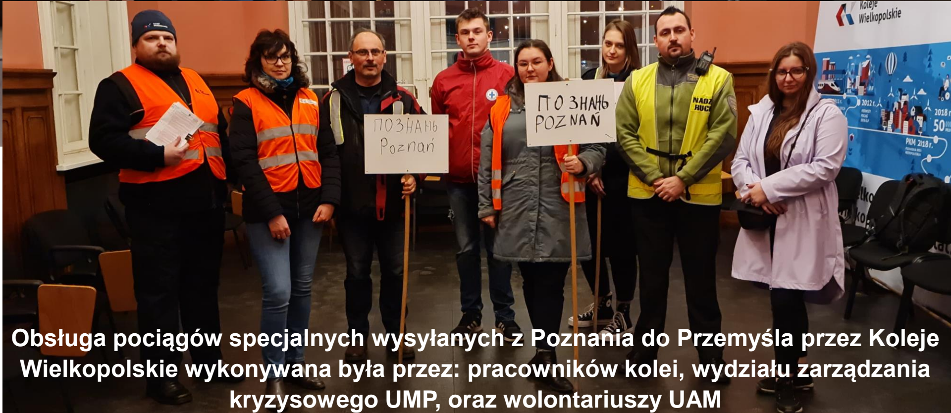
Obsługa pociągów specjalnych wysyłanych z Poznania do Przemyśla przez Koleje Wielkopolskie wykonywana była przez: pracowników kolei, wydziału zarządzania kryzysowego UMP, oraz wolontariuszy UAM