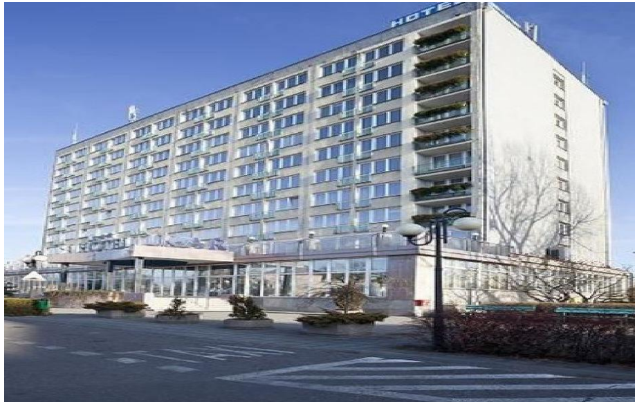
Hotel IKAR ul. Solna