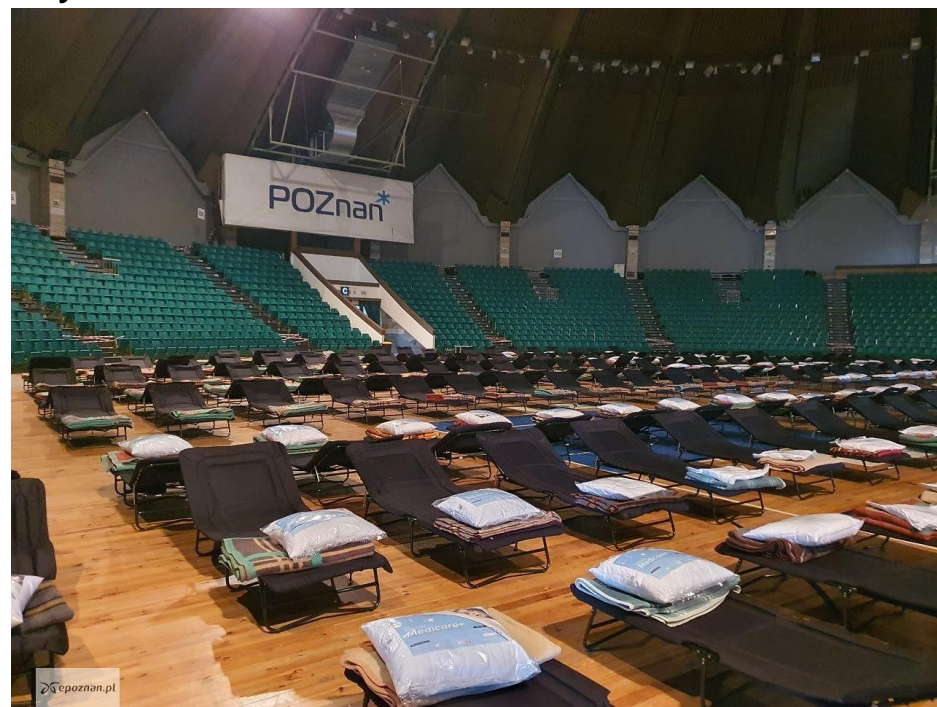
Hala Widowiskowo-Sportowa Arena ul. Wyspiańskiego